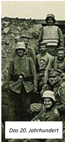
Das 20. Jahrhundert