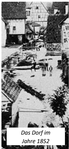
Das Dorf im Jahre 1852