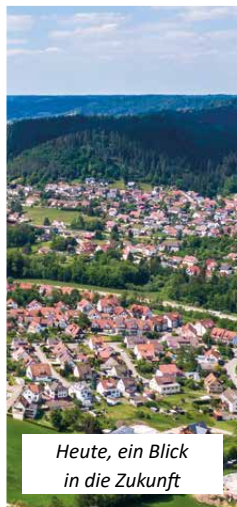
Heute, ein Blick in die Zukunft