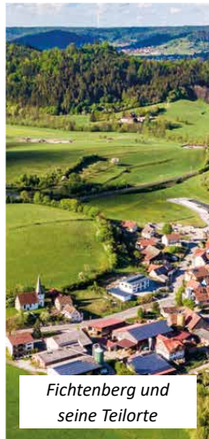
Fichtenberg und seine Teilorte