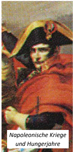
Napoleonische Kriege und Hungerjahre