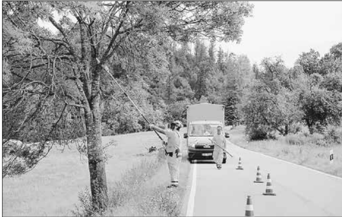
Auf den Straßen im Landkreis unterwegs – Mädchen können beim Girls' Day unter anderem den Job der Straßenwärterin kennenlernen.

Am Donnerstag, den 3.4.2025 findet bundesweit der Girls' Day und Boys' Day statt. Auch das Landratsamt macht wieder mit! Mädchen können im Forstamt, im Straßenbauamt oder Vermessungsamt technische und handwerkliche Berufe kennenlernen. Jungs haben die Gelegenheit, in Verwaltungsjobs im Büro reinzuschnuppern. Eine Anmeldung ist für Schülerinnen und Schüler ab 13 Jahren bis zum 27.3.2025 möglich. Die Anmeldung erfolgt ausschließlich online, über die offizielle Website zum Girls' Day ( https://www.girls-day.de/Radar ) und zum Boys' Day ( https://www.boys-day.de/boys-day-radar ). In das Suchfeld „Was?“ auf der Website „Landratsamt Schwäbisch Hall“ eingeben, dann erscheinen die angebotenen Stellen auf einen Blick.