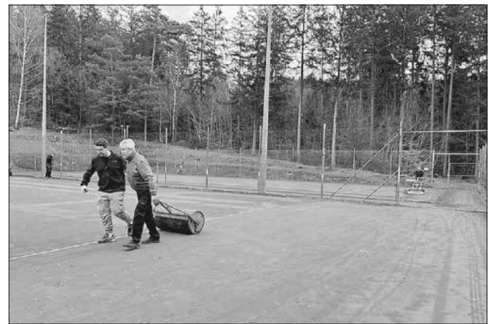
Der aufgefrorene Ziegelmehlbelaag wird mit der Walze wieder heruntergedrückt.

Die Arbeiten werden durch unsere Platzwarte Harald Traub und Ekke Schäfer koordiniert. Die jeweiligen Termine finden wetterabhängig statt und werden kurzfristig über die Arbeitseinsatz-Gruppe bekannt gegeben.