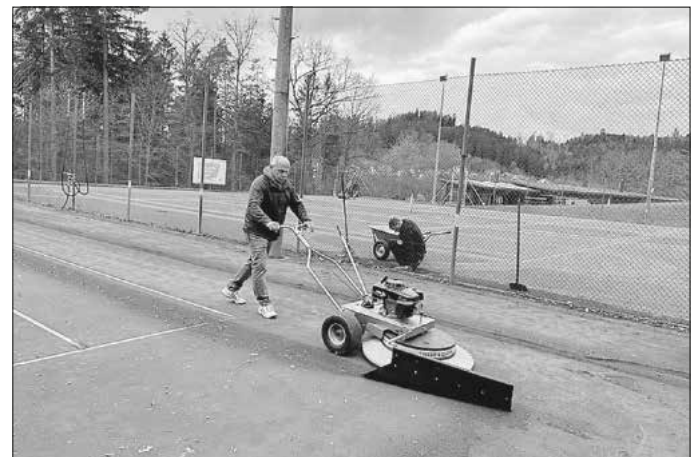
Arbeits erleichterung mit Einsatz des neuen Radialbesens beim TCF