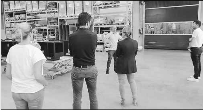
Workshop mit Betriebsbesichtigung bei AFS Airfilter Systeme, Quelle: Klimazentrum

in Form einer Onlineveranstaltung statt. Anmeldung unter www.event.wfgsha.de Weitere Informationen erhalten Sie beim Klimazentrum (Frau Schöner, Tel. 07904/94599-213) oder bei den für die inhaltliche Umsetzung verantwortlichen Beraterinnen und Beratern von CMC (Frau Essich, Tel. 0711/400531-22).