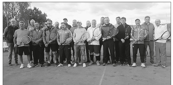
Die Teilnehmer des Vier-Dörfer-Turniers 2024 in Unterrot (die Teilnehmer der Mannschaften des TC Oberrot, der TA Unterrot, der TA Untergröningen und des TC Fichtenberg)