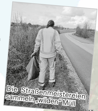
Die Straßenmeistereien sammeln „wilden“ Müll

Auch die Straßenmeistereien des Landkreises haben im Rahmen der Aktion auf Ihre Arbeit aufmerksam gemacht. 73 Parkplätze an Bundes-, Landes- und Kreisstraßen liegen in der Zuständigkeit des Landkreises Schwäbisch Hall. Trotz entsprechender Beschilderung, wird dort häufig Müll abgeladen. Aufgrund der Übertragungsgefahr der Afrikanischen Schweinepest werden die Parkplätze momentan zwei Mal pro Woche von den Straßenmeistereien kontrolliert und bei Bedarf gereinigt. Bei größeren Mengen Müll oder sperrigen Teilen kommt ein LKW mit Ladekran zum Einsatz. Einmal pro Jahr werden alle Straßen im Zuständigkeitsbereich des Landkreises (knapp 1.200 km) von den Straßenmeistereien abgelaufen, um Müll einzusammeln.