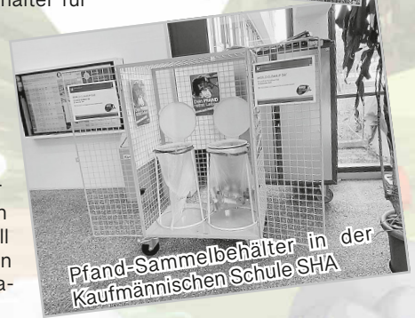
Pfand-Sammelbehälter in der Kaufmännischen Schule SHA